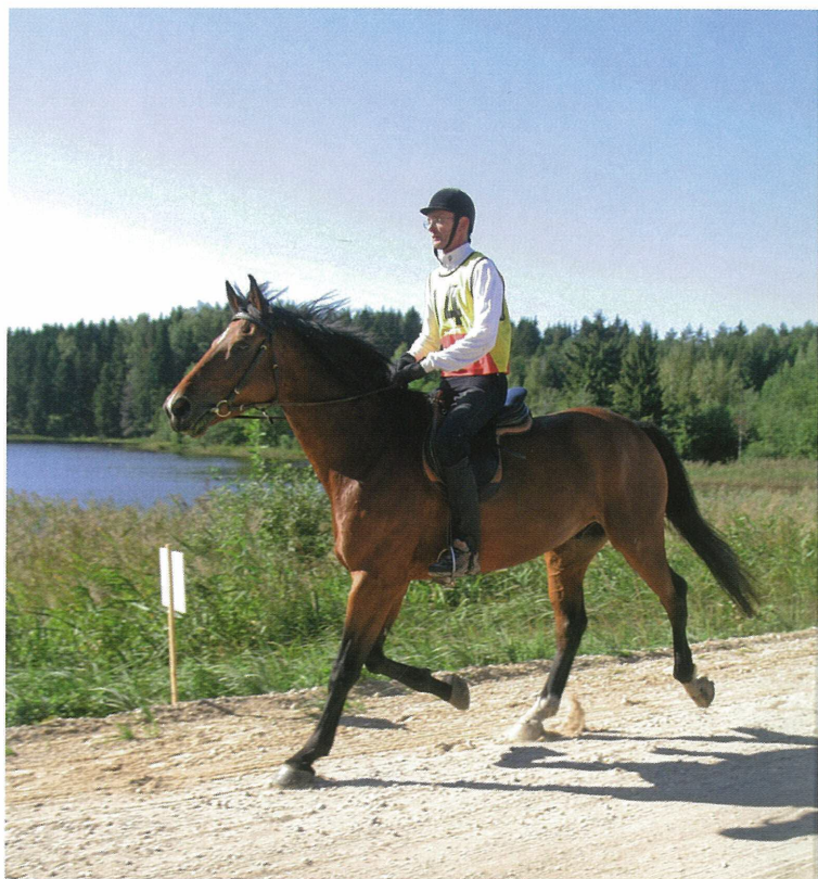
Oopuse elu esimene kestvusratsutamise võistlus.

Oopus oli jahil suurepärase. Ei tormanud liigselt, kuid liikus kogu päeva kergelt ja julgelt ning isegi märjaks ei läinud õieti. Mina sain oma ratsu üle üksnes uhkust tunda, kuid jahikaaslastele tundus uskumatu, et tegemist alles kolmeaastase hobusega. Järgnevas paariks aastaks muutuski vastupidavuse arendamine põhitreeninguks.