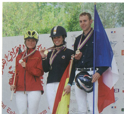
Euroopa Meistrid 2011.

nende seljas rahvuslippe lehvitati. Esimesena tõusid pjedestaalile avatud võistluse kolm esimest. Hobused jäeti hooldajate kätte.