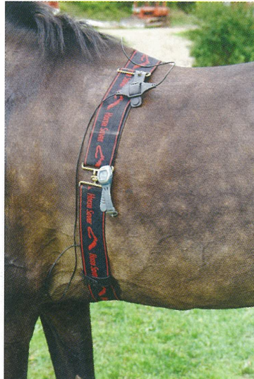
Pulsimonitor Zlatogradil. Selle abil fikseeritakse hetk, mil pulss nõutud tasemest allpool püsima jääb. Alles siis saab veterinaaralale minna.