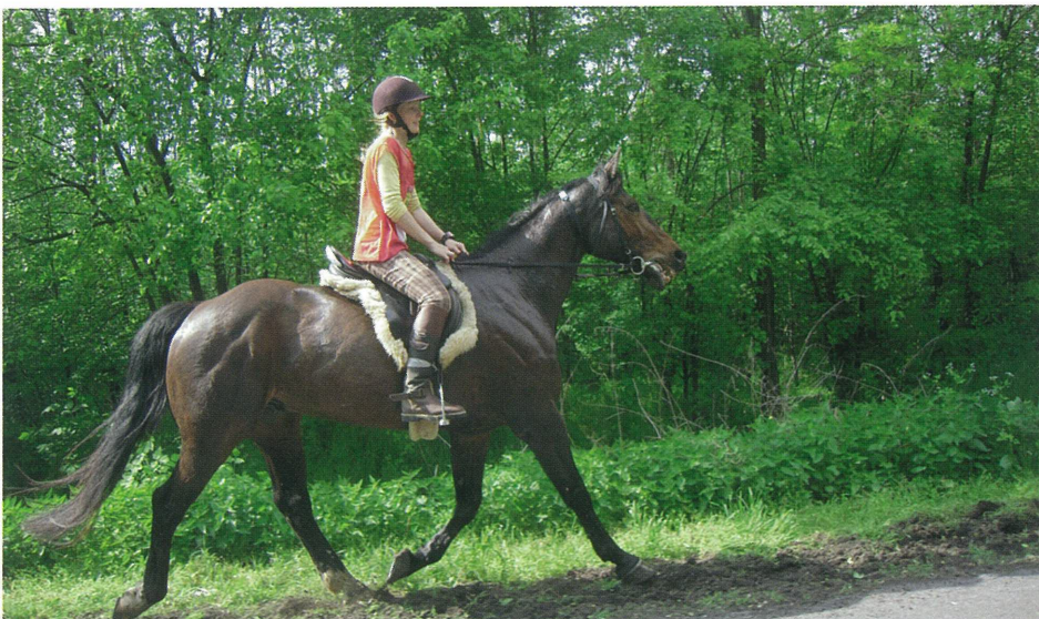
< Läbitud on juba 139 kilomeetrit.

Võistluse tegi raskeks see, et Marian ja Oopus pidid sõitma 110 km üksi. Juhtgrupiga ei riskinud nad alguses kaasa minna ja tagumistega liiga aeglaselt ei olnud ka isu sõita. Veidi aega sai koos sõita ühe itaallasega, kes aga kahjuks ühtegi võõrkeelt ei rääkinud. Teine kaassõitja ilmus, selg ees, viimasel ringil. See hobune enam eriti värske ei olnud ja nii jäi Mariani kardetud lõpuspurt ära. Neljandale kohale jõudmiseks tuli lihtsalt lõpuni sõita.