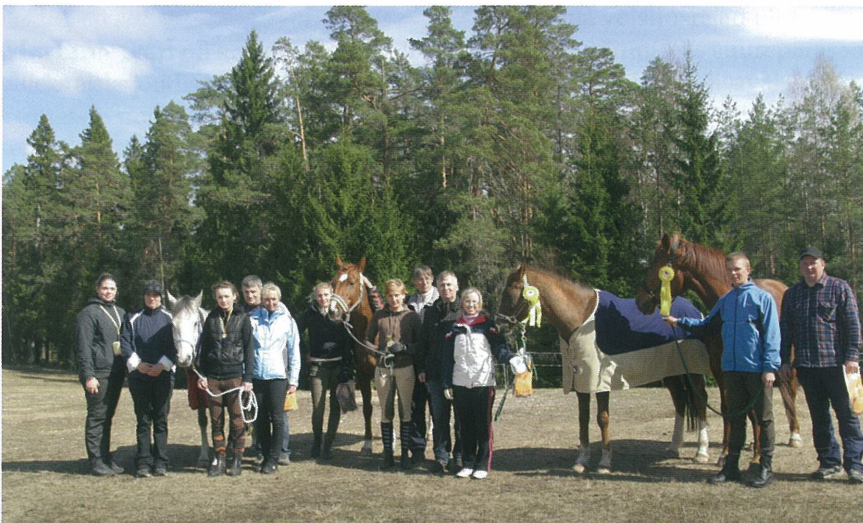
Ratsarügemendi Klubi Tartust oli nendel võistlustel esindatud täies koosseisus.