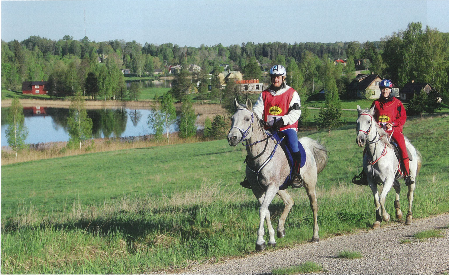
Rahvusvahelise võistluse Haanjamaa 2012 rada kulges läbi maalilise Rõuge.