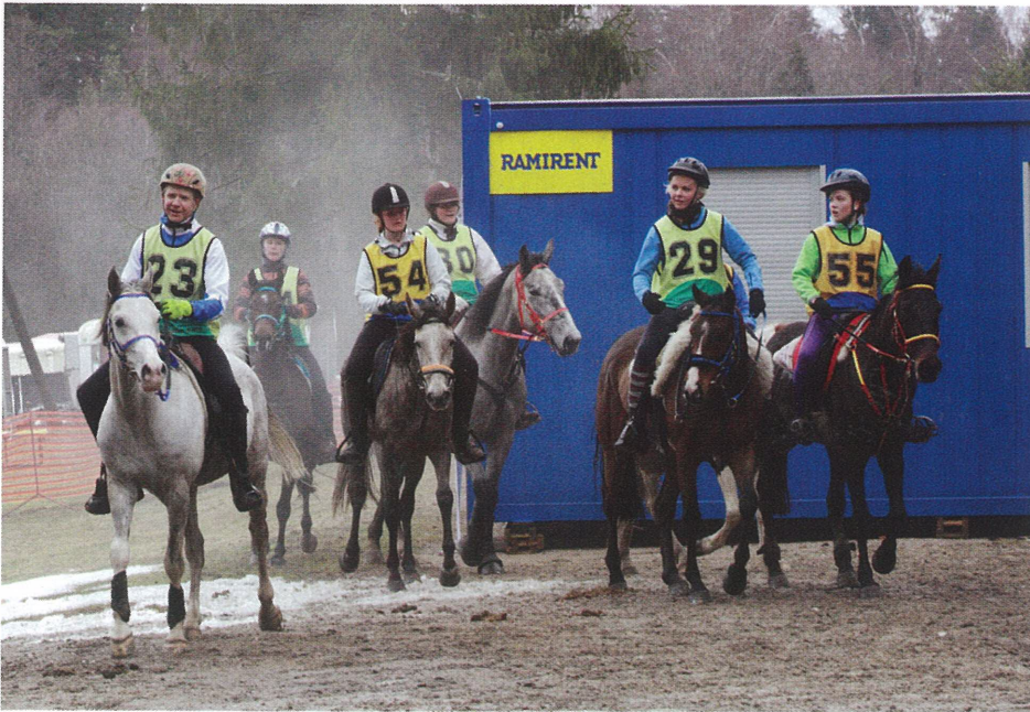
Start on antud. Kevadine võistlus Kõrvemaal.

ajaloos toimuvad Eestis Põhja- ja Baltimaade meistrivõistlused kestvusratsutamises. Loodetavasti on selleks ajaks heas vormis ka hulk Eesti kestvushobuseid, et saaksime väärikalt tänavust hõbemedalit kaitsta.