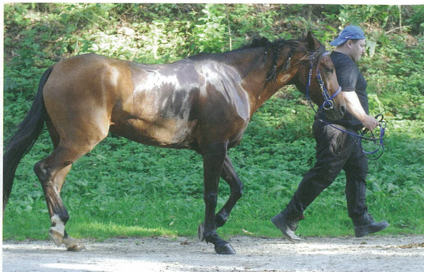
Zodina veterinaarkontrolli traavil.

Vigvami arvamus ajast: “Tõesti tore on vahel reisile saada. Kui see Apache’i peremees poleks vaid auto-ga nii metsikult kihutanud. Mitte ei saa aru, kas tal läks meelest, et hobused auto peal ja et minusuguse vanamehe jalad pole ju enam teab mis põ-